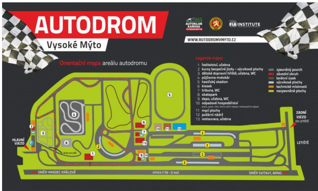
Trať pro kategorie – Mini GP, Jawa, Ohvale